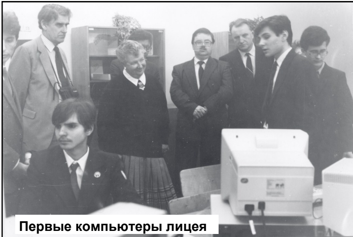
Первые компьютеры лицея