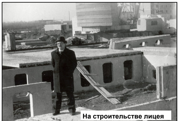
На строительстве лицея