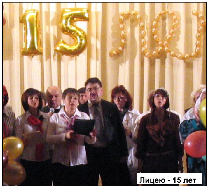
Лицею - 15 лет

Он ушел. Но для меня это словно он в очередной раз покинул директорский кабинет по делам, кивнул секретарю, когда уходил, только на этот раз не спустился вниз по лестнице, а поднялся вверх, со своего четвертого этажа прямо в небо.